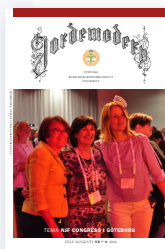
Jordemodern Barmorskeförbundets tidskrift och medlemstidning.

Spännande berättelser och kraftfulla bildreportage – läs om 300 år i livets tjänst på barmorskeforbundet.se